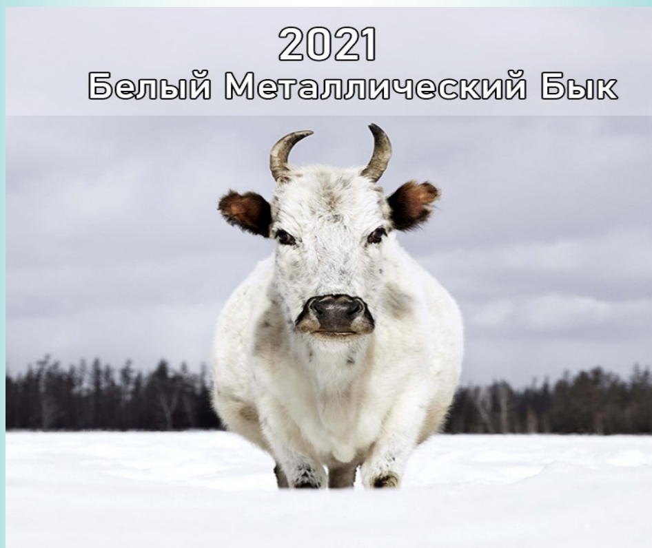
2021 Белый Металлический Бык

Как встречать Новый год 2021 – год Белого Металлического Быка 2021 год пройдет под покровительством Белого Металлического Быка – мудрого, решительного и упорного животного, которое знает, чего хочет и к движется к своим целям. Год будет положительным для всех, кто ставит цели, действует для их достижения, кто трудолюбив и настойчив, кто честен и ответственен. 2021 год Быка обещает быть более спокойным и размеренным, чем предыдущий год Крысы.