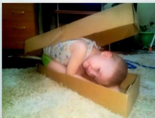
Максим Д., 2 года 6 месяцев «Мама, ищи меня»